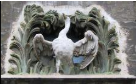
Photo 8: « Le ..... » << ou « Maison des Bouchers »